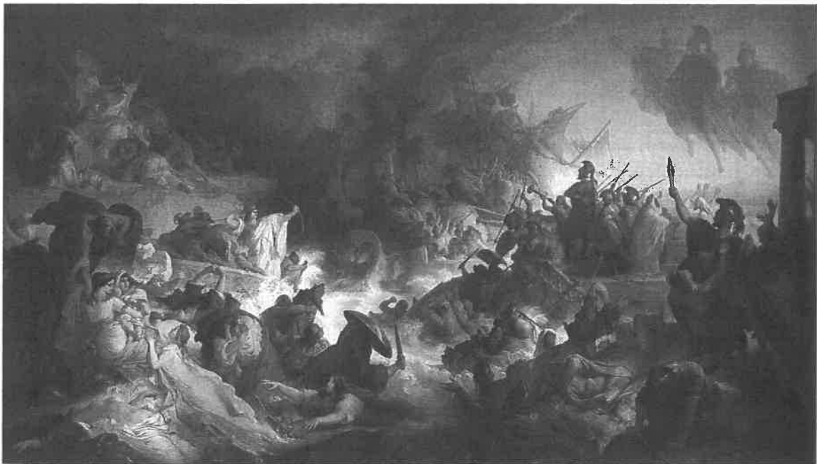
De zeeslag bij Salamis [Wilhelm von Kaulbach, 1868]

zische. Een luttel aantal stadstaatjes die net de traditionele, op mythische goden terende koningen opzij hadden geschoven om als volk zelf het heft in handen te nemen, stonden op het punt overruled te worden door de wereldmacht van het moment. In termen van nu: een paar Caraïbische eilandjes worden bedreigd door de VS, of ook: Oekraïne's jonge democratie staat oog in oog met de Russische wereldmacht. En het onmogelijke gebeurt. In het geval van de jonge, wankelende democratieën in het Griekenland van het begin van de vijfde eeuw voor onze jaartel-