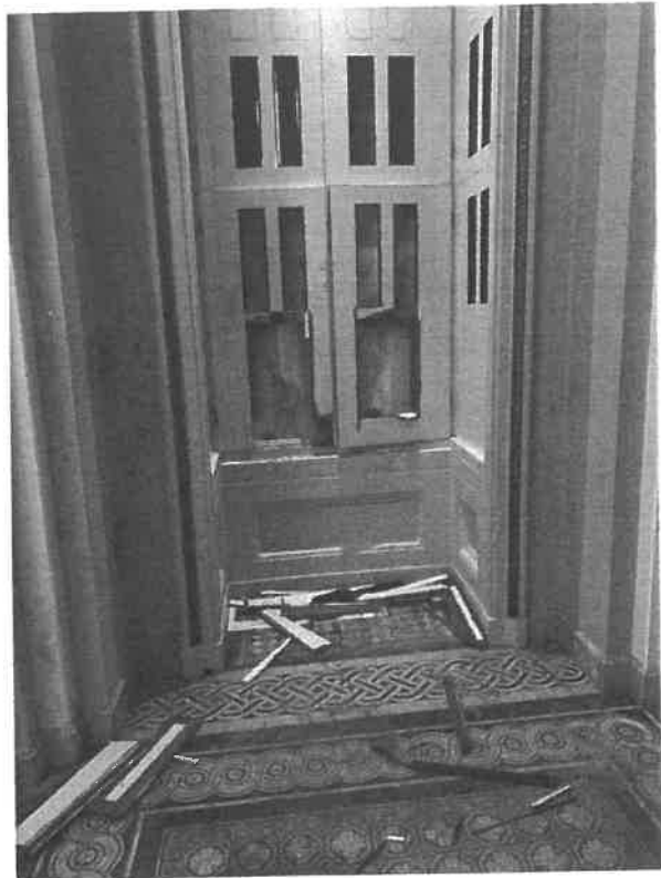
Interieurschade na de bestorming van het Capitool

De strijd die momenteel aan de gang is, herkennen we in de strijd die, zacht uitgedrukt, een eeuw geleden ook al eens de wereld in rep en roer heeft gezet. Kort door de bocht gesteld, laat die zich samenvatten als de