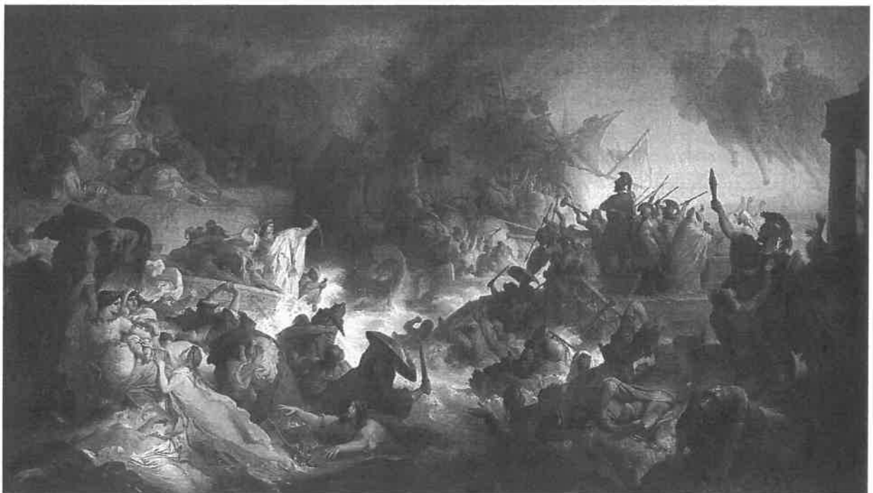
De zeeslag bij Salamis [Wilhelm von Kaulbach, 1868]

zische. Een luttel aantal stadstaatjes die net de traditionele, op mythische goden terende koningen opzij hadden geschoven om als volk zelf het heft in handen te nemen, stonden op het punt overruled te worden door de wereldmacht van het moment. In termen van nu: een paar Caraïbische eilandjes worden bedreigd door de VS, of ook: Oekraïne's jonge democratie staat oog in oog met de Russische wereldmacht. En het onmogelijke gebeurt. In het geval van de jonge, wankele democratieën in het Griekenland van het begin van de vijfde eeuw voor onze jaartel-